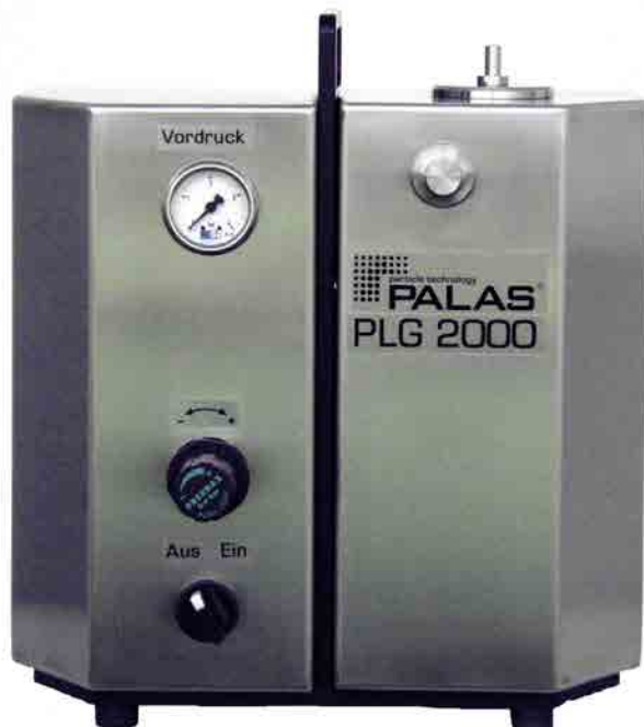
图 1:PLG 2000 启动

PLG 2000 是一种用于空调房间的冷雾化器。如果室内无法进行空气调节,则应使用可加热版本的设备,例如 PLG 2000 H。