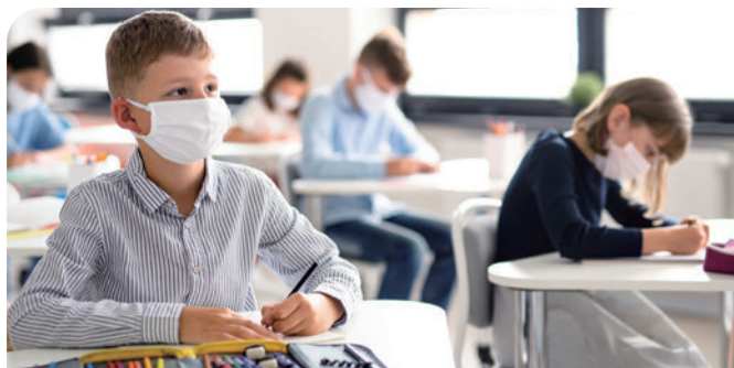
室内气溶胶扩散研究