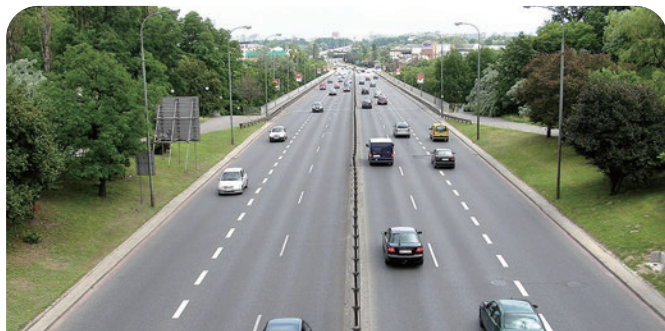
测量任何位置的颗粒物浓度