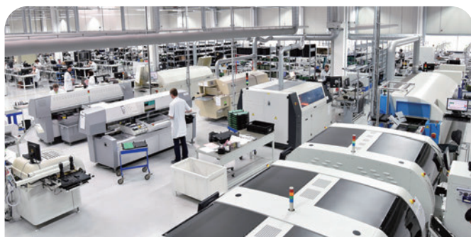
工厂车间颗粒移动测量