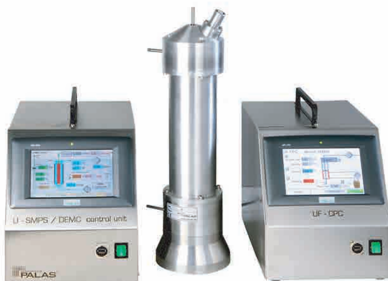
图 1: U-SMPS 2050X / 2100X / 2200X

Palas®通用扫描电迁移率粒径谱仪（U-SMPS）可提供两种版本。长分类柱（2050X / 2100X / 2200X型号）可以确定8至1200 nm的粒径分布。该系列已经集成了X射线源作为中和器（参见图1），代替放射性中和器（例如使用Kr-85），优点是在运输过程中无需遵循针对放射源的要求。